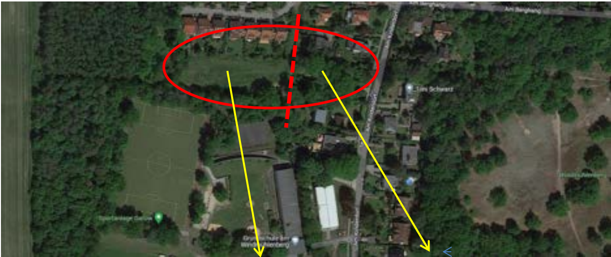
Luftbild mit Lage der Fläche